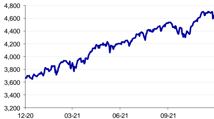
S&P 500 -indeksin pisteluku 12 kk

Helsingin pörssi laski tiistaina -1,1%. Vaihdetuimmista osakkeista laskussa olivat Stora Enso R (-3,0%), Neste (-2,8%) ja Nokia (-2,1%). Nousussa olivat Sampo A (+0,8%) ja Nordea Bank (+0,1%).