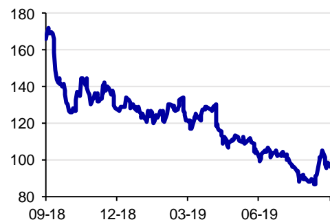
Danske Bankin osakekurssi 12 kk, DKK