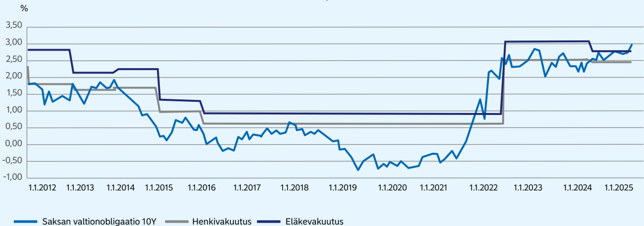
21. 10 VUODEN KORKO- JA KOKONAISHYVITYS 2012–2025 Säästöhenki- ja eläkevakuutus

Nordea Henkivakuutus Suomi Oy:n konsernitilinpäätös on jätetty laatimatta KPL 6 luvun 1 §:n 4 momentin nojalla.