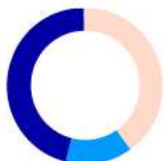
Ansvarsskuldens fördelning 31.12.2017

Liv- och pensionsförsäkringarna samt kapitaliseringsavtalen är förknippade med räntestrukturer av två slag. De försäkringar som trädde i kraft före 5.5.2003 gottgörs varje månad med en beräkningsränta. Därtill kan de gottgöras med en kundbonus som fastställs kalenderårsvis i efterskott. Storleken av den beräkningsränta med vilken kunden gottgörs beror på försäkringens begynnelse datum, och den har varit 4,5, 3,5 eller 2,5 procent. För de sparlivförsäkringar som gottgörs med en beräkningsränta på 4,5 procent har det gjorts en s.k. fondkomplettering, som innebär att beräkningsräntan på dessa försäkringar är 3,3 procent. I boksluten för 2015-2017 gjorde bolaget en fondkomplettering på viss tid. Som en följd av detta sjunker beräkningsräntan på liv- och pensionsförsäkringsbeståndet med beräkningsränta till 1,0 procent åren 2016–2023. De försäkringar som trädde i kraft 5.5.2003 eller senare gottgörs varje månad med en årlig ränta som bolaget på förhand har fastställt för högst ett år och med en eventuell tilläggsränta som fastställs kalenderårsvis i efterskott. År 2017 var årsräntan 0,4 procent (med undantag av pensionsförsäkringar, vars årsränta var 0,7 procent). Tilläggsräntan på alla försäkringar med årsränta var 0,25 procent för 2017. Beräkningsräntan på dessa försäkringar och avtal med årlig ränta är noll.