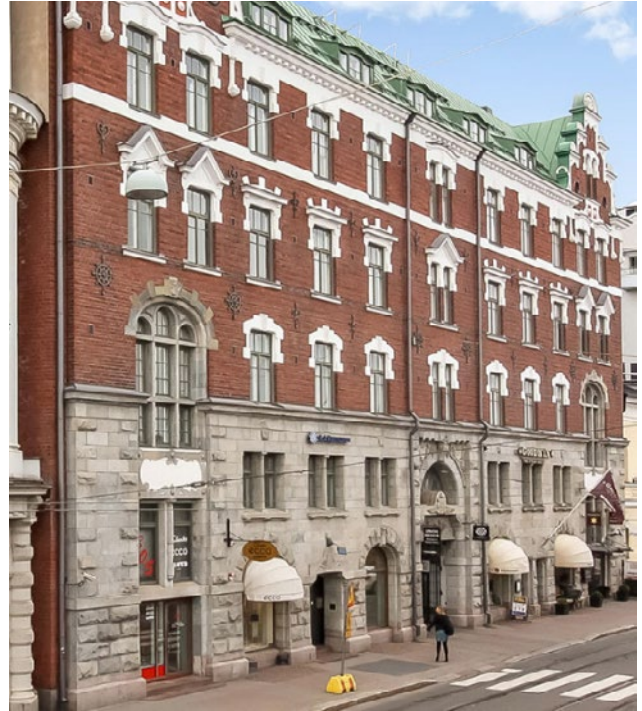
Eteläranta 14, Helsinki