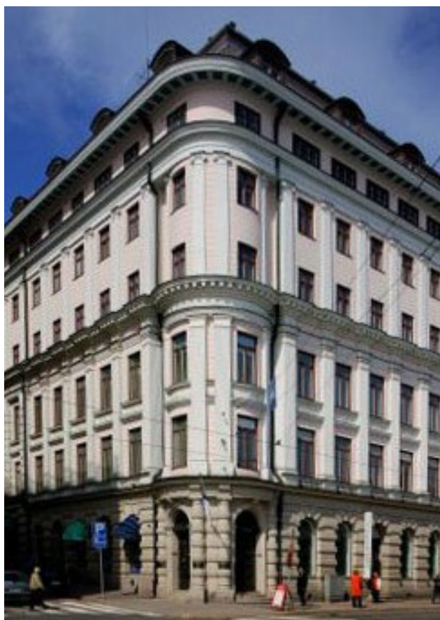
Eteläranta 12, Helsinki