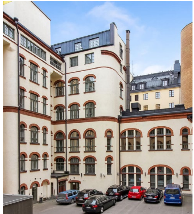
Unioninkatu 17, Helsinki